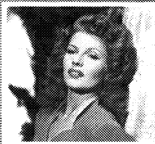
Un'anziana con Alzheimer. Sopra: alcuni malati famosi di Alzheimer, dall'alto: Margaret Thatcher, Ronald Reagan e Rita Hayworth.

IN ITALIA SONO 900 MILA LE PERSONE COLPITE DA QUESTA MALATTIA DEGENERATIVA, CHE NON SI PUÒ CURARE, MA SOLO RALLENTARE. E ALTRETTANTE LE FAMIGLIE, CHE HANNO BISOGNO DI AIUTO COSTANTE.