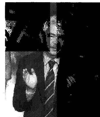
Annie Girardot (a fianco), malata di Alzheimer, e l'ex presidente della Catalogna, Pasqual Maragall , che ha reso nota la sua malattia.